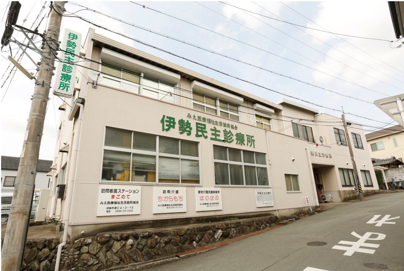
(写真上) 現在の伊勢民主診療所 (2023年撮影)